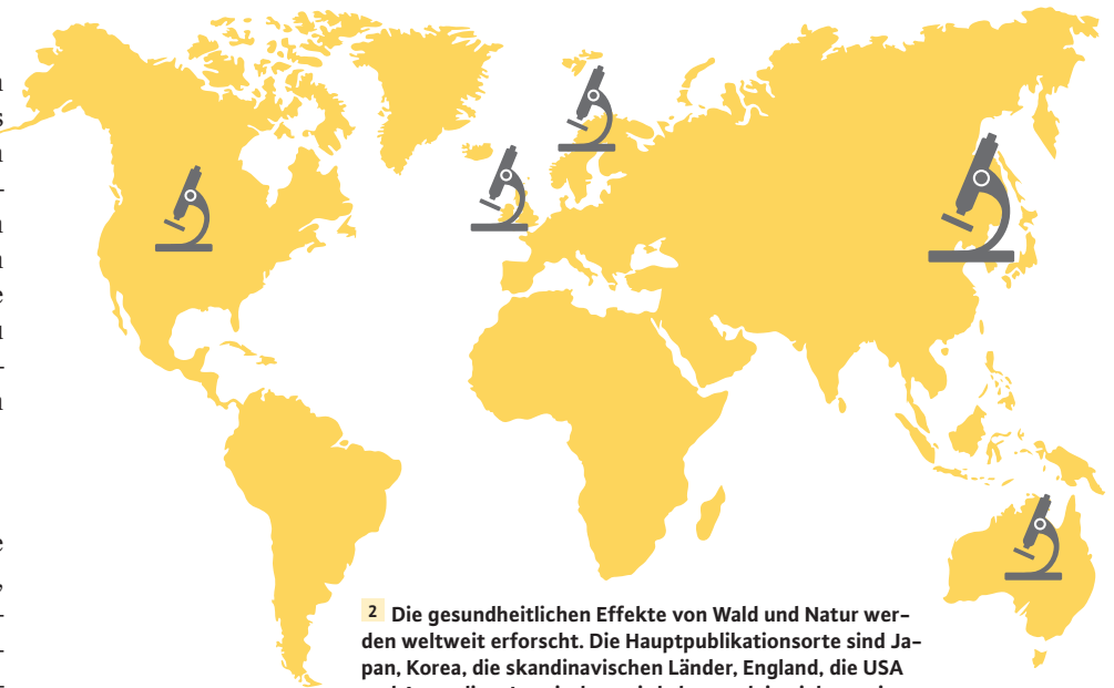
2 Die gesundheitlichen Effekte von Wald und Natur werden weltweit erforscht. Die Hauptpublikationsorte sind Japan, Korea, die skandinavischen Länder, England, die USA und Australien. Inzwischen wird aber auch in vielen weiteren Ländern an der Erforschung des Themas gearbeitet.

In der Umweltpsychologie existieren verschiedene theoretische Erklärungsmodelle, warum unterschiedliche Naturlandschaften die Menschen faszinieren und zur Entschleunigung und Regeneration beitragen. Die beiden wichtigsten Theorien, sind die Stressreduktionstheorie (SRT) und die Aufmerksamkeitsrestorationstheorie (ART). Beide Theorien argumentieren, dass Menschen, die sich in natürlichen Umgebungen entwickelt haben und erst seit wenigen Generationen in städtischen Umgebungen leben, so genetisch »programmiert« sind, dass sie auf bestimmte Aspekte der Natur positiv reagieren. Laut SRT rufen Umgebungen, die sich in evolutionären Zeiten günstig auf das Überleben ausgewirkt haben, po-